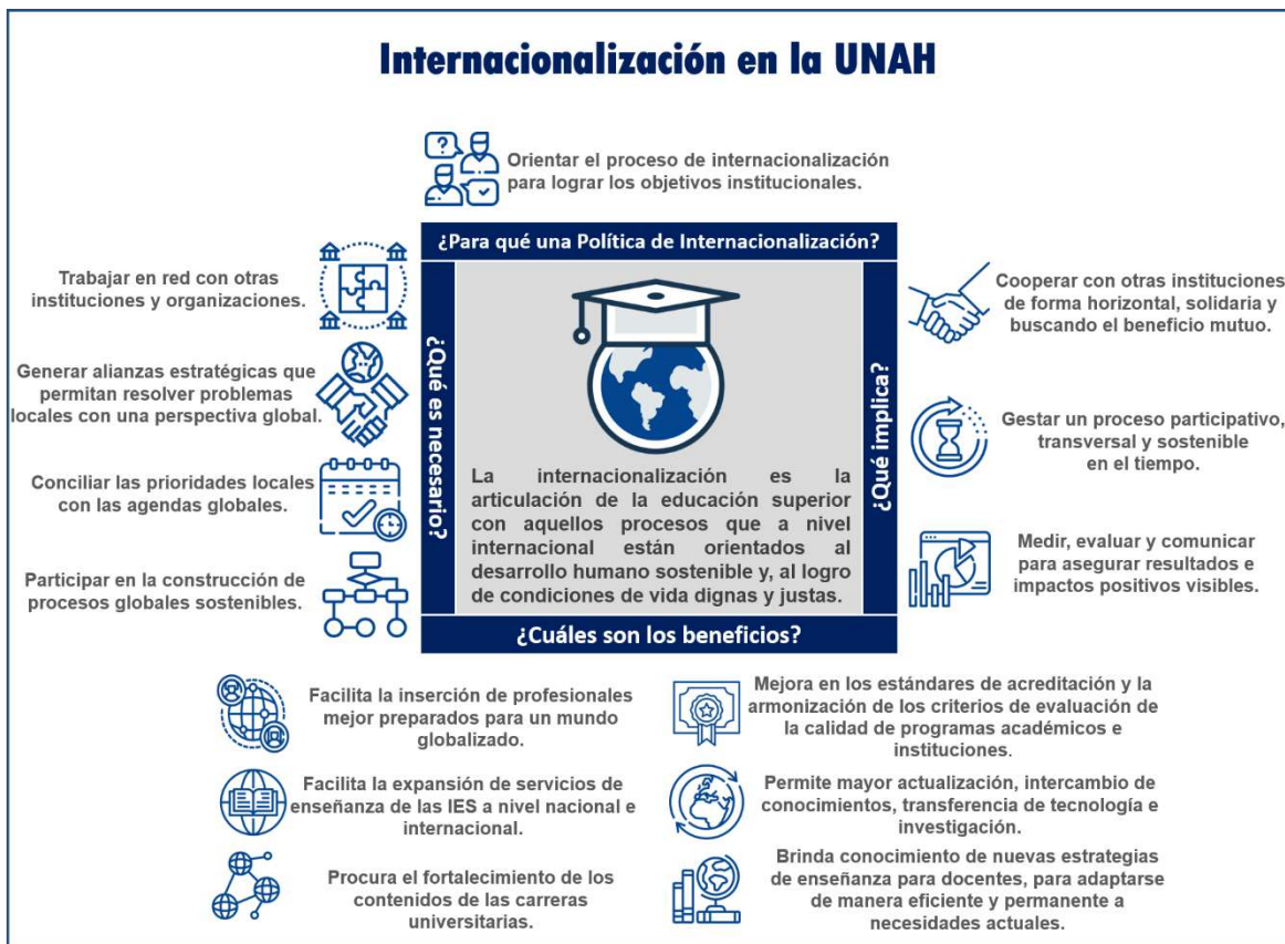
Figura 2. Infografía Internacionalización UNAH. Elaboración propia VRI-UNAH 2020

Sin duda se requieren una mayor promoción y visibilidad de la Internacionalización y a la vez fortalecer las capacidades para la gestión estratégica que consolide los procesos de mejora en términos de calidad en todas sus dimensiones. Es necesario que la comunidad UNAH conozca el concepto institucional de Internacionalización, entienda las premisas que deben cumplirse, las implicaciones que esta apuesta supone y reconozca los beneficios colectivos institucionales con impactos previstos para la sociedad (infografía resumen en figura No.2).